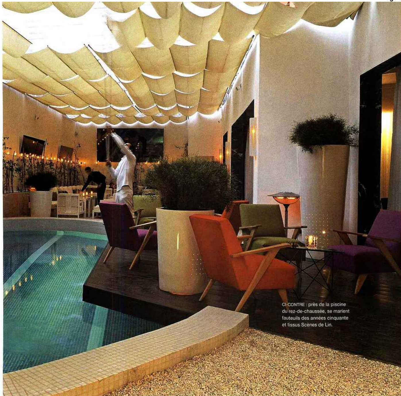
CI-CONTRE : près de la piscine du rez-de-chaussée, se marient fauteuils des années cinquante et tissus Scènes de Lin.

de conférences, des toilettes ornées de mosaïques ; au rez-de-chaussée, un restaurant de cent cinquante couverts (avec le patio), fréquenté par Pierre Bergé et le Tout-Marrakech ; sur quatre étages, quarante-cinq chambres (35, 45 et 72 m 2 ), dont quatre suites de 150 m 2 ; enfin, sur le toit, une terrasse de 650 m 2 , avec un bar, un solarium et une petite piscine. Outre l'agrandissement du Café de la Poste avec le Studio KO, les projets de Clémence Pirajean sont l'aménagement d'un troller (bateau de pêche) et d'un îlot écologique près de Bali, puis d'un domaine d'une dizaine d'hectares au pied de l'Atlas. Encore des aventures familiales, on l'aura deviné ! ■